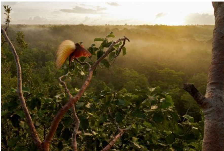
Il rituale di corteggiamento di una paradisea maggiore. Isole Aru, Indonesia