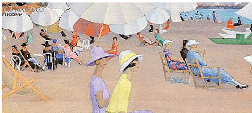
Il manifesto della rassegna "Luce Marina" con opere di Moses Levy