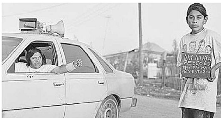
Una immagine firmata da Martin Weber