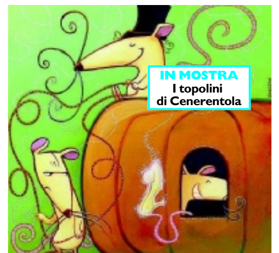
IN MOSTRA I topolini di Cenerentola

degli anelli, Harry Potter ecc). Un grande viaggio attraverso il tempo rappresentato in immagini e disegni creati da Valentina Grassini (giovane artista e fumettista milanese che vive e lavora in Germania), testi didattici, ricostruzioni ambientali, installazioni multimediali. Si rivivranno così le atmosfere del mondo antico, la stanza dei fratelli Grimm, un immaginario laboratorio per cartoni animati della Walt Disney, e infine un ambiente in cui attraverso la tecnologia «chroma key» i bambini potranno calarsi negli scenari fantastici del mondo dell'animazione.