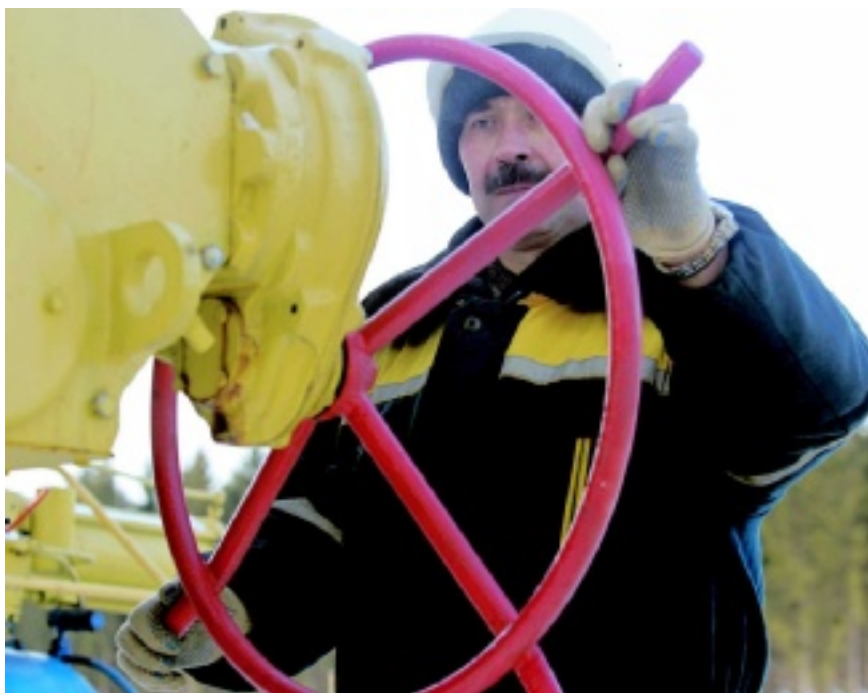
ENERGIA Con i gasdotti ci può essere sempre chi chiude le valvole

ROSIGNANO DAL SONDAGGIO SUL SITO DE «LA NAZIONE»: I SÌ ALL'89%