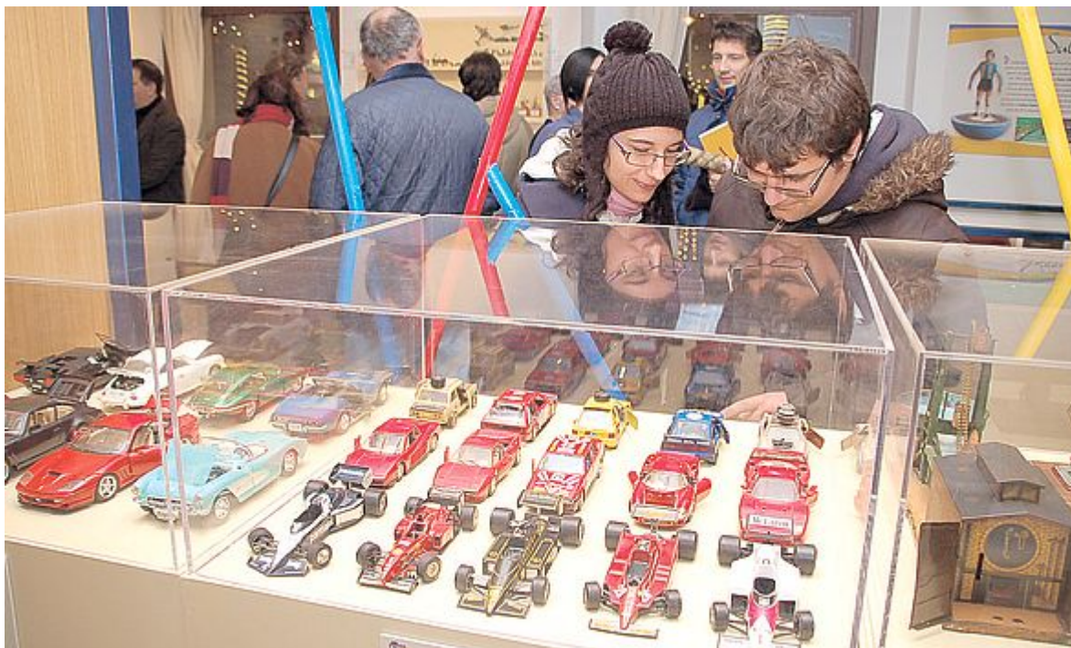
COLLEZIONE Le automobiline di ogni dimensione e foggia, uno dei «punti» più visitati della mostra