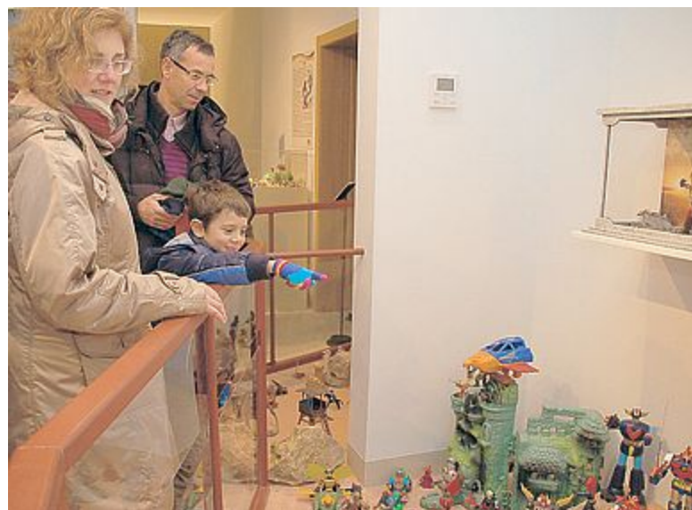
GRANDI & PICCINI Il fascino dei giocattoli ha colpito davvero tutti...