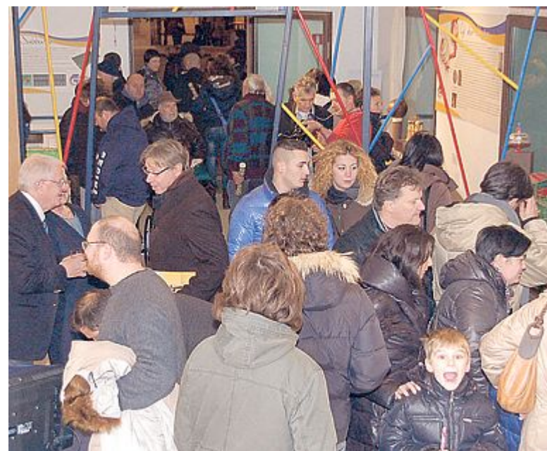
FOLLA L'inaugurazione ha soddisfatto le attese: grande partecipazione