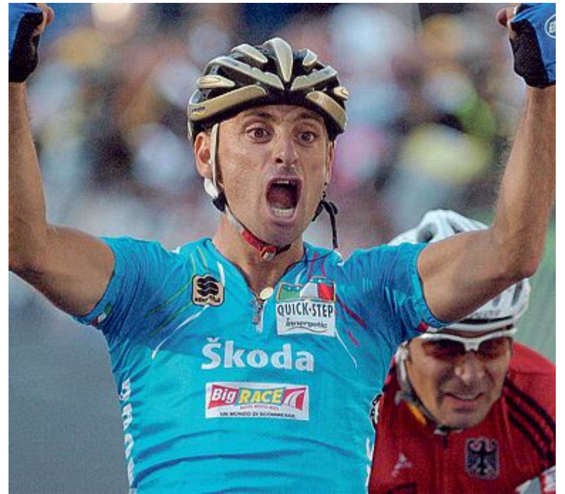
VIP Paolo Bettini , campione mondiale e olimpico, ora commissario tecnico della nazionale di ciclismo, vera gloria e vanto di Bibbona

19 sarà a disposizione un servizio navetta gratuito che collegherà la zona industriale nel parcheggio di fronte al Tremila fino alla zona del centro storico. Alle 21 la serata din Pasquetta proseguirà con il consueto appuntamento del palio delle botti, la competizione tra i rioni di Bibbona giunta alla 24ª edizione. Manifestazione che vede i partecipanti spingere le botti su per le strette salite del paese. Iniziativa curata dalla locale Pubblica Assistenza.