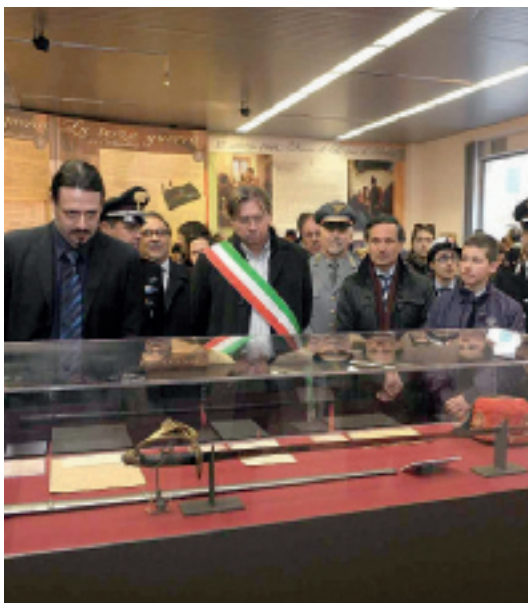
ANNIVERSARIO Dopo la mostra su Garibaldi (a sinistra), ecco la conferenza con Zeffiro Ciuffoletti (a destra)

INSIEME per Castagneto tira quindi le orecchie all'amministrazione comunale che ha aderito, con una specifica delibera, alla Società della salute Bassa Val di Cecina e per farlo esamina con attenzione la normativa che pone dei seri dubbi sull'utilità della stessa Società della Salute. I consiglieri sottolineano che «la Corte dei Conti si è espressa recentemente ponendo forti dubbi sulla reale utilità della Società della Salute criticandone direttamente la reale creazione e considerandola una fonte di spesa nel complesso sistema di organizzazione amministrativa e di programmazione del sistema sanitario». Insieme per Castagneto fa presente al sindaco e all'amministrazione comunale che «nonostante il lungo periodo di sperimentazione a tutto oggi il sistema della Società della Salute non riesce a dare risposte concrete per il miglioramento, l'efficienza e la garanzia della promozione e del miglior accesso dei cittadini ai servizi socio assistenziali». Quindi dopo un'attenta lettura normativa e dopo la verifica sul campo della inutilità della Società della Salute, fonte secondo Insieme per Castagneto solo di spesa, «si sollecita il sindaco a riconoscere l'inutilità dell'esperienza e quindi a recedere».