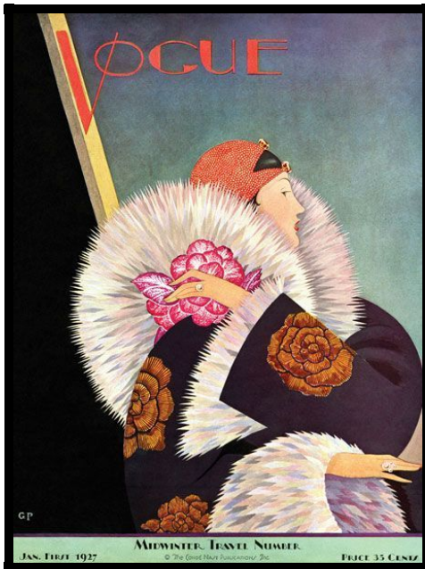
Copertina di Vogue US (gennaio 1927). Illustrazione di George Wolfe Plank

“Mai giudicare un libro dalla copertina”: questo vorrebbe la cara e vecchia saggezza popolare, declinandolo anche nella versione “l'abito non fa il monaco”.