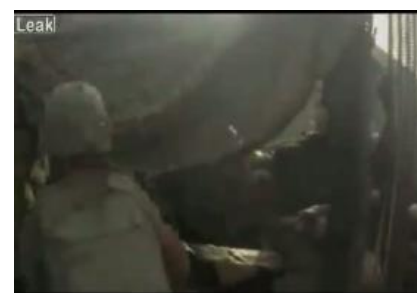
La guerra vista dall'elmetto del soldato