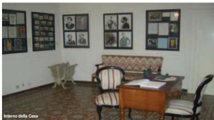
Interno della Casa