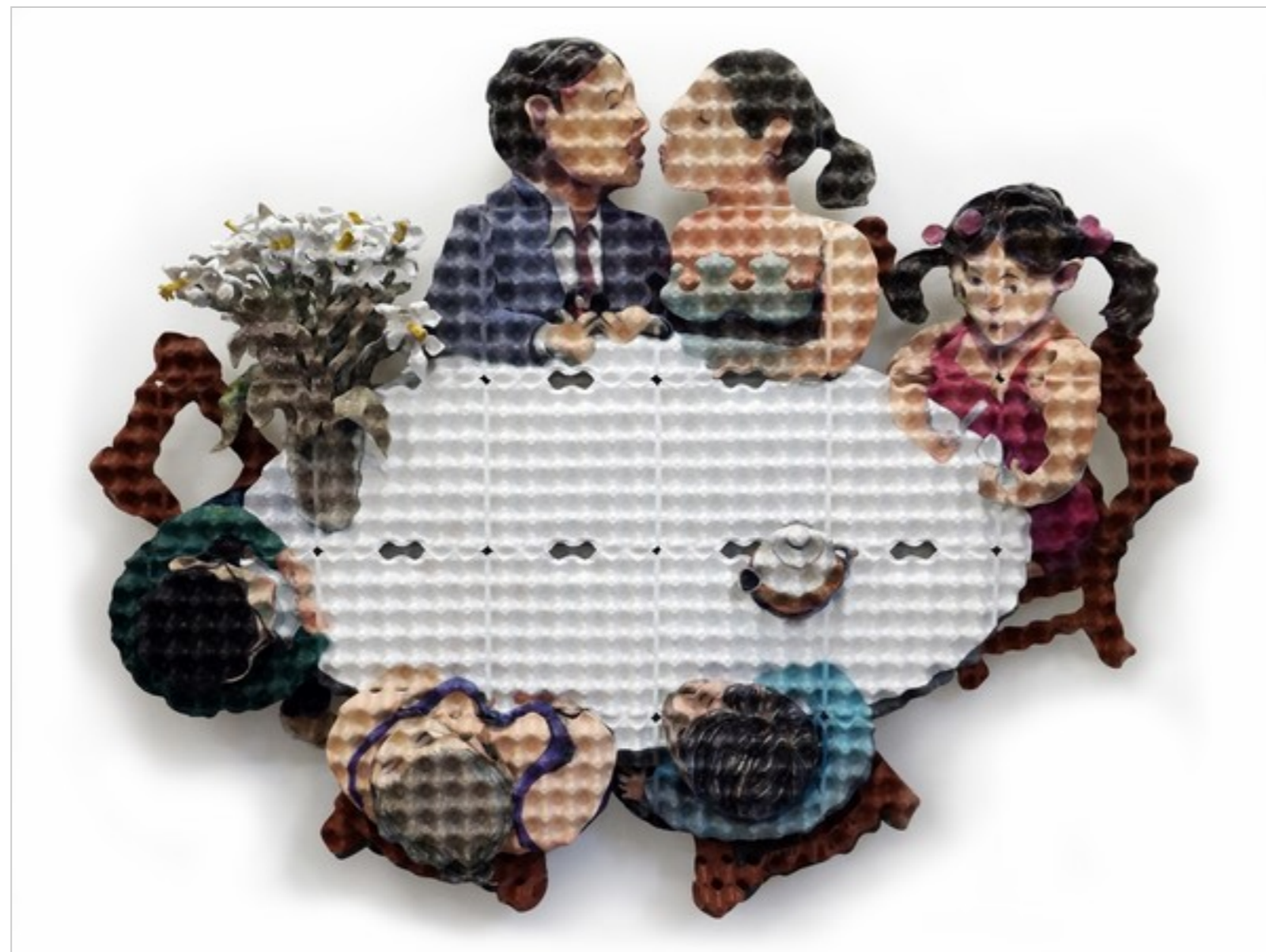
© Enno de Kroon | Enno de Kroon, Celebration, 2013. Acrilico e paperclay su cartoni per uova, 163x205x32 cm. Collezione dell'artista