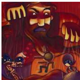
Mangiafuoco, da Pinocchio. [Vedi la foto originale]

FONDAZIONE HERMANN GEIGER vai alla scheda di questa sede Exibart.alert - tieni d'occhio questa sede Corso Giacomo Matteotti 47 (57023) +39 0586631227, +39 0586631227 (fax) info@fondazionegeiger.it www.fondazionegeiger.it individua sulla mappa Exisat individua sullo stradario MapQuest Stampa questa scheda Eventi in corso nei dintorni