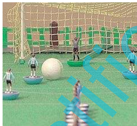
CALCIO DA TAVOLO Il subbuteo è un gioco amatissimo che riproduce lo sport più amato dagli italiani