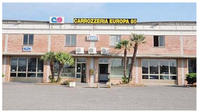
La sede della carrozzeria Europa in via dei Parmigiani

Rubati due computer e attrezzi professionali durante il raid tra i capannoni di via dei Parmigiani