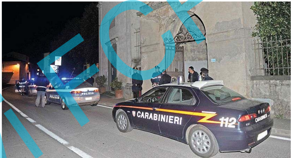
Polizia e carabinieri in un'immagine di repertorio

Polizia e carabinieri a loro volta assicurano di aver potenziato i servizi ma prima di parlare di aumento, insomma prima di analizzare i dati, vogliono terminare di raccoglierti. «A fine mese potremo tirare un pri-