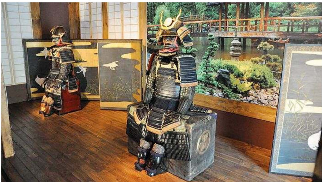
Una foto della mostra allestita alla fondazione Geiger