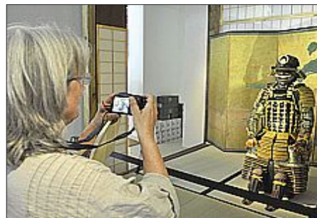
Grande successo La mostra "Kimono e Samurai. Il gesto. L'eleganza. Lo spirito" è allestita nella sala esposizioni in piazza Guerrazzi a Cecina