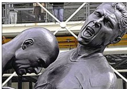
Odio e amore L'antica sfida tra Italia e Francia ha preso forma in una statua