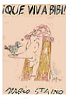
Viva Biba Il disegno di Staino