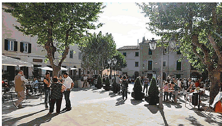
Un evento in piazza del Popolo a Castagneto